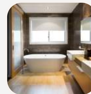
el cuarto de baño fürdőszoba