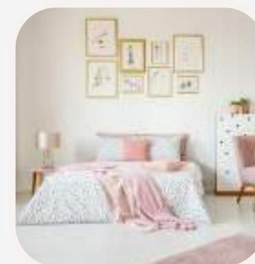
el dormitorio hálószoba