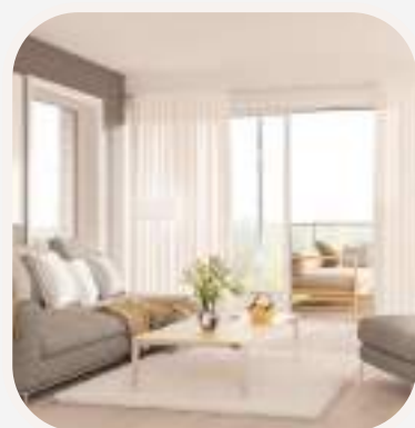
el salón nappali