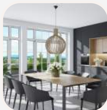
el comedor étkező