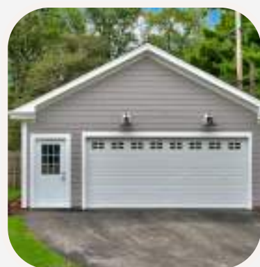
el garaje garázs