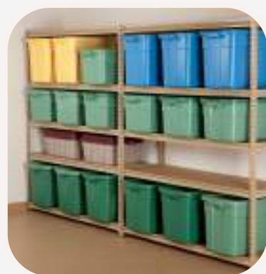
el trastero tároló