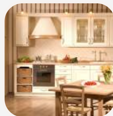
la cocina konyha