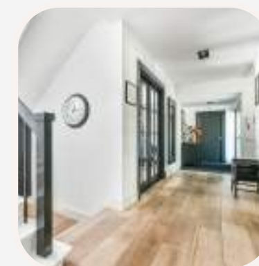
el recibidor előszoba