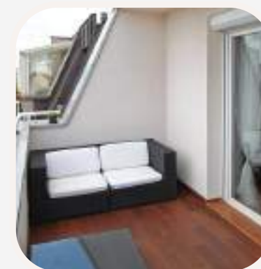
la terraza terasz