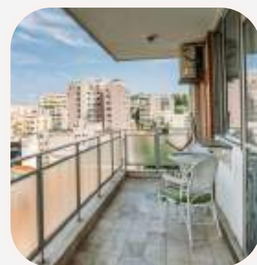
el balcón erkély