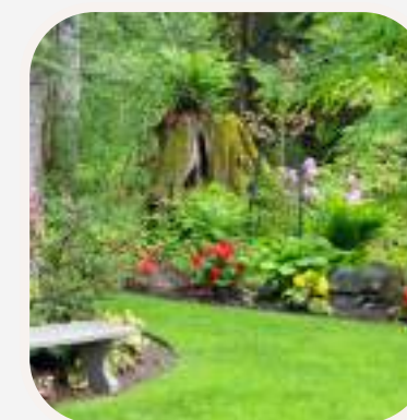
el jardín kert