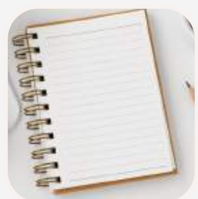
escribir en el cuaderno írni a füzetbe