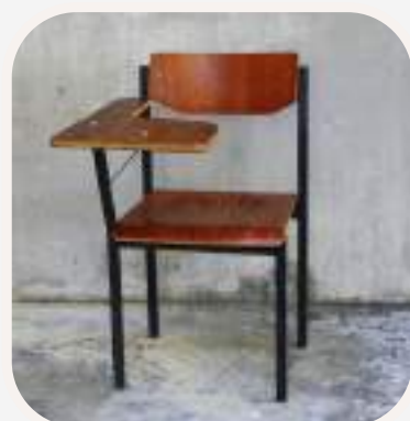
la silla szék