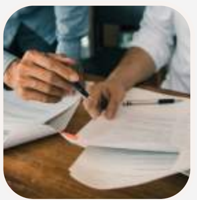
repasar el tema átismételni a témát