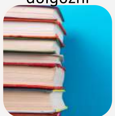
abrir el libro kinyitni a könyvet