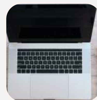
el portátil lap top