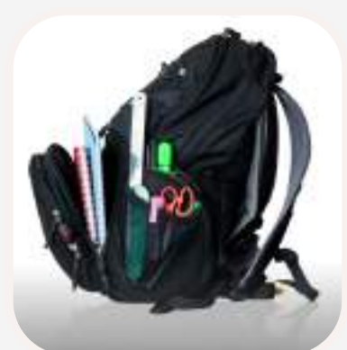
llevar una mochila hátitáskát vinni