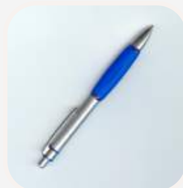
el bolígrafo toll