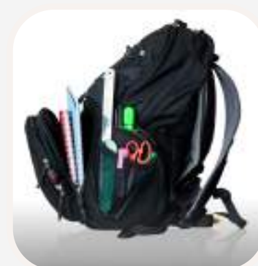
la mochila hátitáska