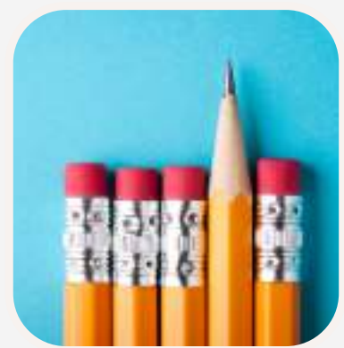
escribir con lápiz ceruzával írni