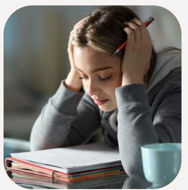
memorizar el tema memorizálni a témát