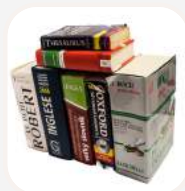
el diccionario szótár