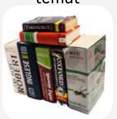
usar el diccionario használni a szótárt