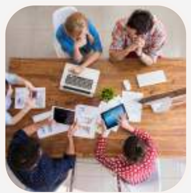
trabajar en equipo csapatban dolgozni