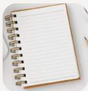
el cuaderno füzet