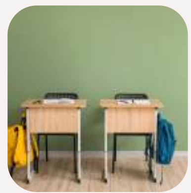
limpiar la mesa letakarítani az asztalt