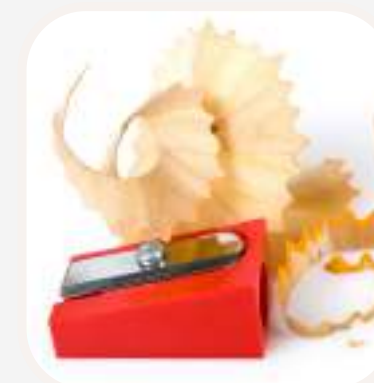
el sacapuntas hegyező