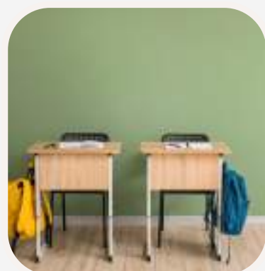
la mesa asztal