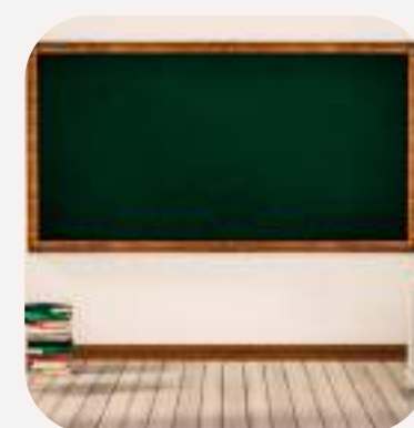
la pizarra (digital) (digitális) tábla