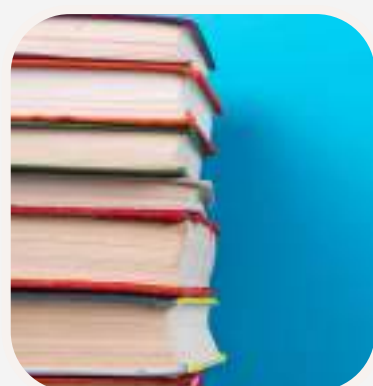
el libro könyv