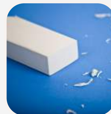
la goma de borrar radír