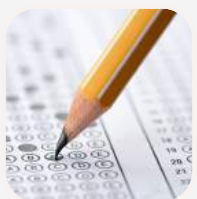
practicar para el examen vizsgára gyakorolni